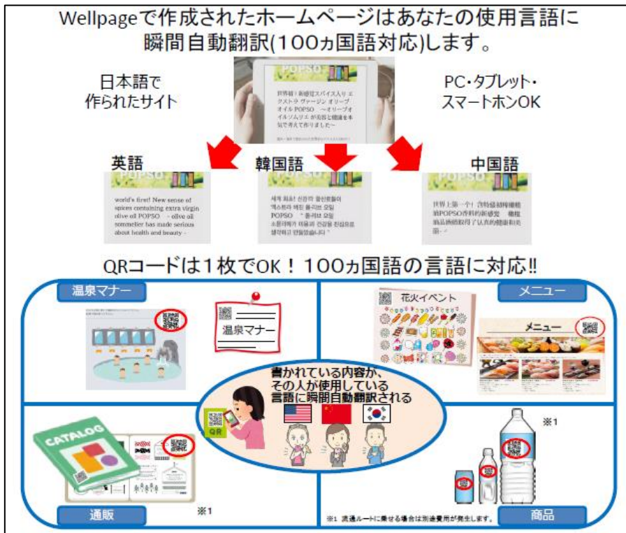
図3 瞬間自動翻訳のサービス説明図

本事業を支援するため、「ラカラ基金」を設立します。活動予算を運用し、ラカラの企業アカウントのフォロワー約数千万人に対しての情報配信の費用や地域に還元する中華系決済の売上0.1%などを管理します。