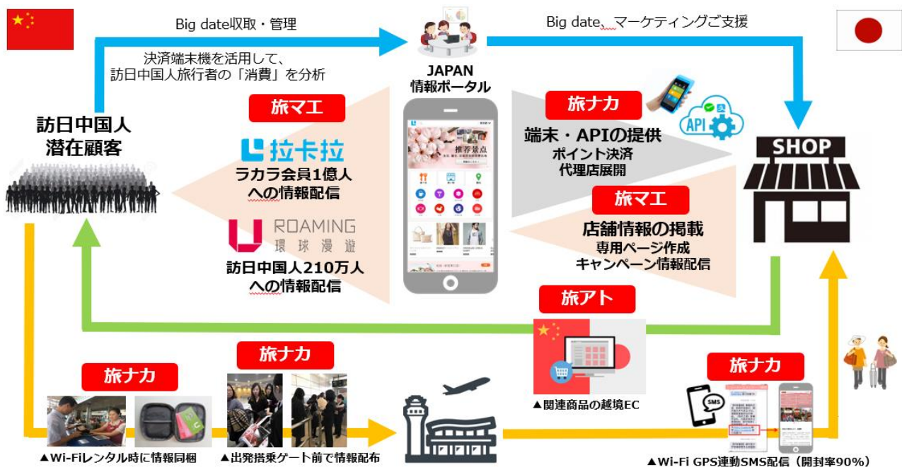
図 2 インバウンドの送客・誘客サポートに関する解説図

これまでインバウンド対応を行っていない、またはやり方が分からないといった地域の店舗に対して、インバウンドの受け入れ体制の構築や誘客支援を実施するほか、インバウンド需要を取り込める商品・観光資源等の開発支援を行います。